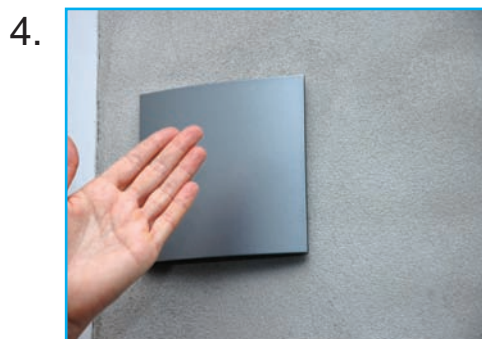
Skilt og bagplade klikker sammen og låses