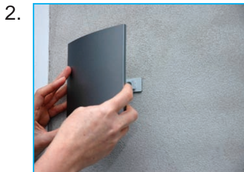
Skilt sættes på bagplade