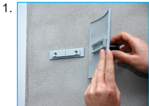
Bagplade skrues på væg