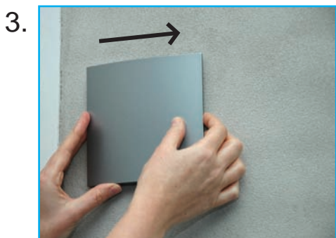
Skilt skydes 5-10 mm til siden