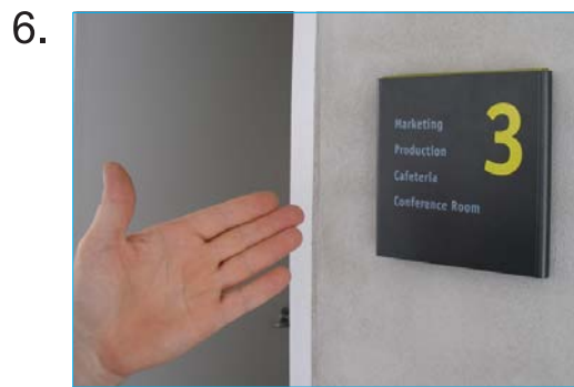
Skilt og bagplade klikker sammen og låses