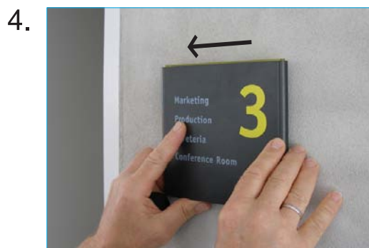
Skilt skydes 5 - 10 mm til siden