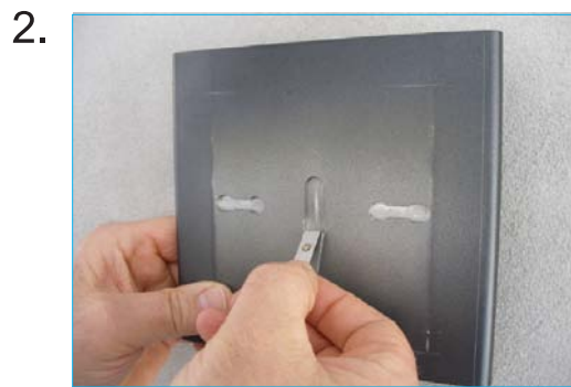
Fjeder monteres på bagsiden af skilt