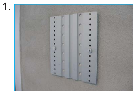
Bagplade skrues på væg