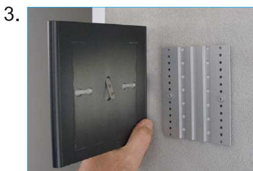
Skilt monteres på bagplade