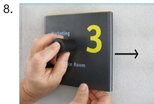
Skilt tages af